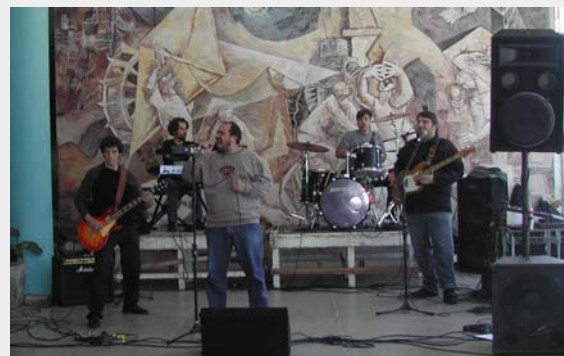
Apresentação da banda Mobdick no hall do CT

Durante o evento, a banda Mobdick fez um show para os estudantes no dia 12 de junho, proporcionando um momento de diversão e integração entre os participantes da Semana Acadêmica.