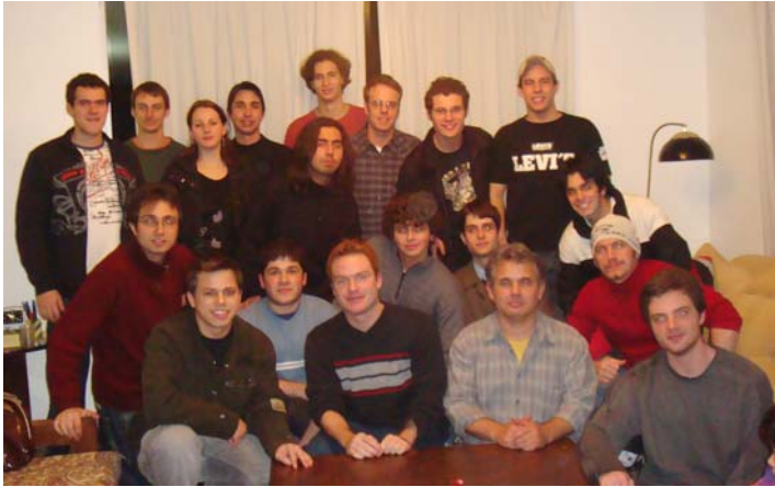
Integrantes do PET-EE

O Programa de Educação Tutorial da Engenharia Elétrica, PET-EE, é um programa que abrange ensino, pesquisa e extensão. Além disso, o grupo tem o compromisso com a formação de qualidade de seus integrantes e com o crescimento do Curso de Engenharia Elétrica da UFSM.