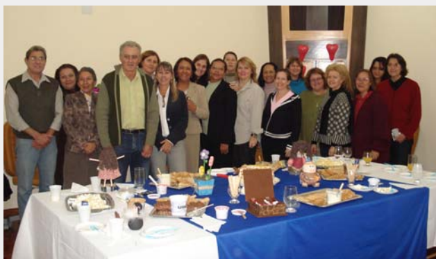
Comemoração em homenagem ao Dia das Mães