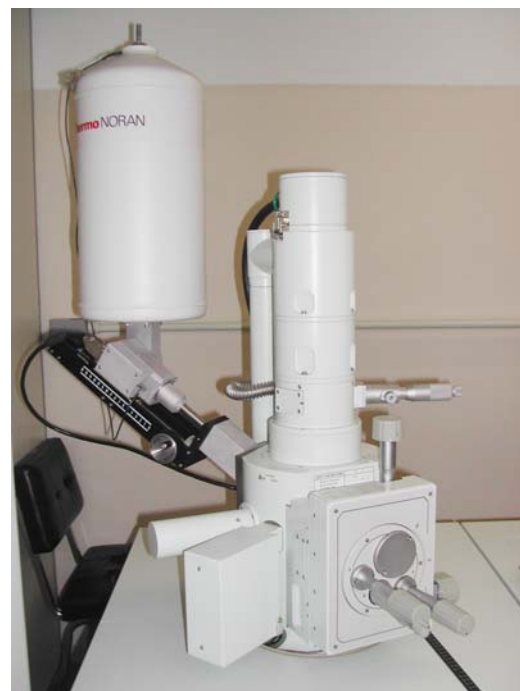
Equipamento custou 500 mil reais